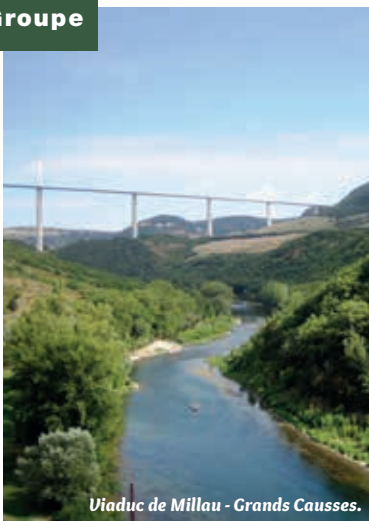
Viaduc de Millau - Grands Causses.