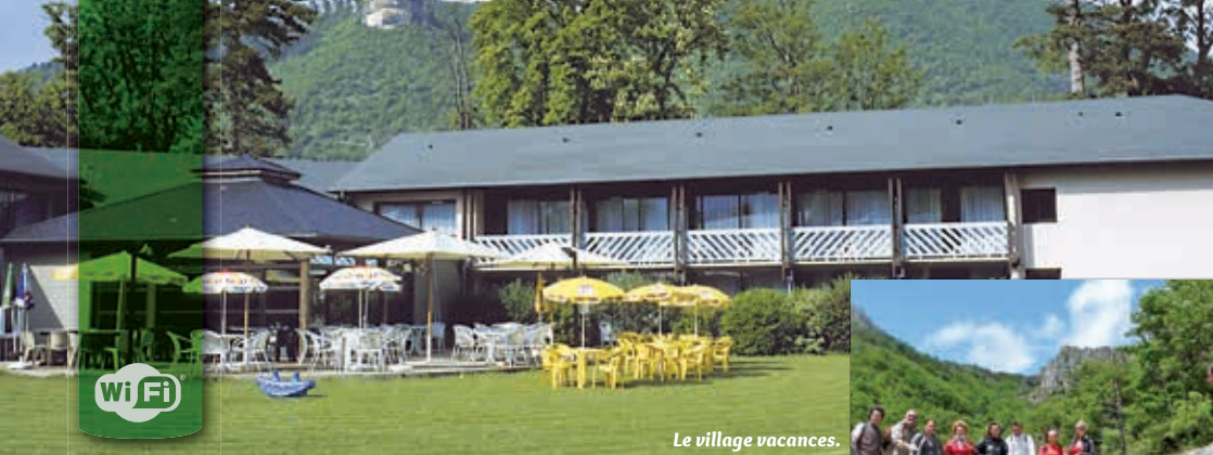
Le village vacances.