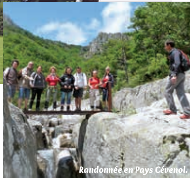
Randonnée en Pays Cévenol.

A u pied du Larzac et à l'entrée des Cévennes, Nant est le point de départ idéal pour découvrir les sites incontournables de la région : le Larzac, les Gorges du Tarn, les Cévennes et le Mont-Aigoual, Roquefort. Paysages variés et contrastés : dépaysement garanti !