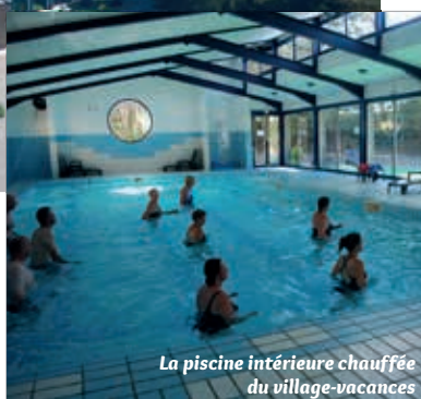
La piscine intérieure chauffée du village-vacances