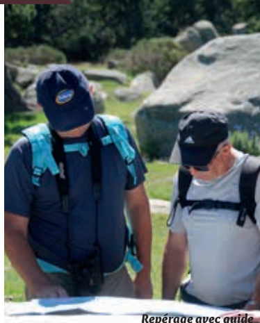
Repérage avec guide